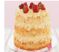
Gâteau des anges