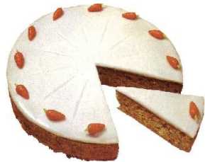
Gâteau aux carottes