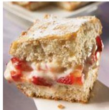
Shortcake aux fraises