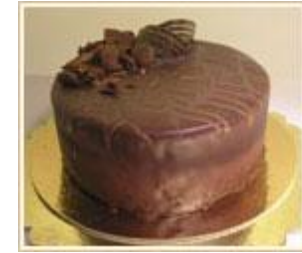
Gâteau à la vanille : glaçage au chocolat