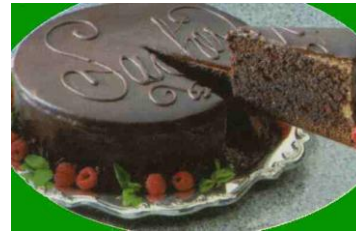
Gâteau du diable au chocolat